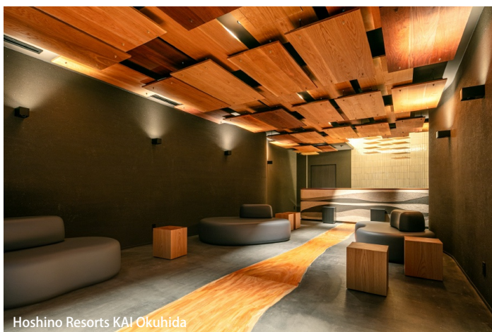
Hoshino Resorts KAI Okuhida