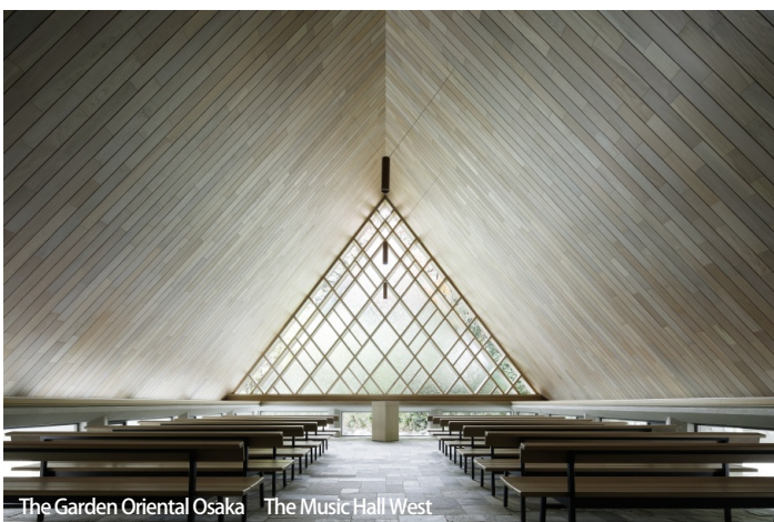
The Garden Oriental Osaka The Music Hall West