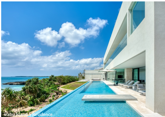
Irabu Island 3 Residence